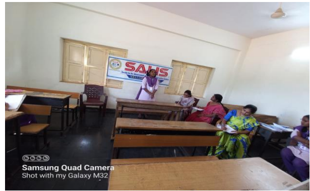
Samsung Quad Camera Shot with my Galaxy M32