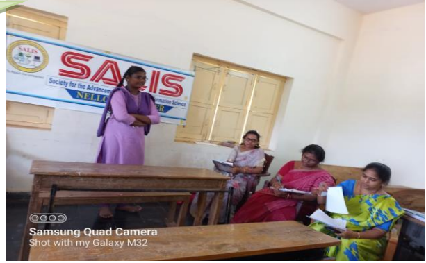
Samsung Quad Camera Shot with my Galaxy M32