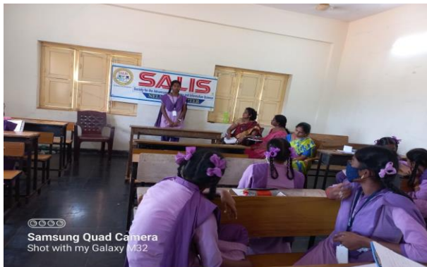
Samsung Quad Camera Shot with my Galaxy M32