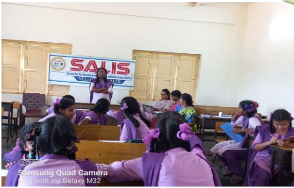
Samsung Quad Camera Shot with my Galaxy M32